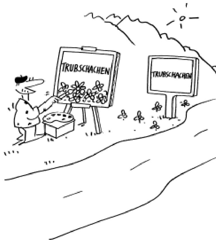
P. F. SCHNIGER - CARTOON